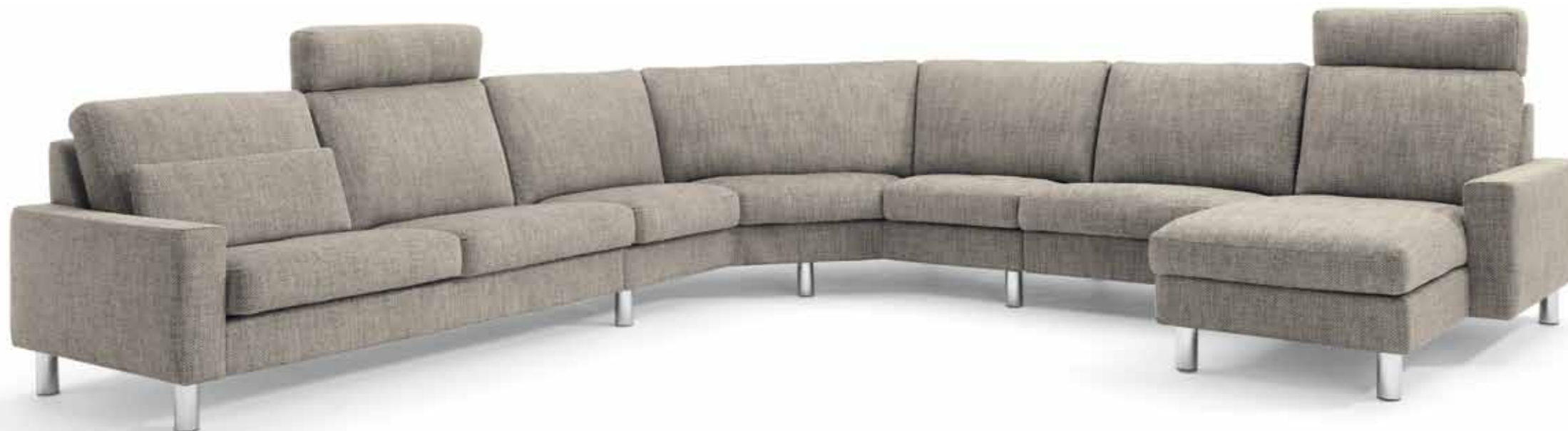
Eckkombination // Sitzhöhe: 43 cm // Bezug: Stoff Bonny 1020.041