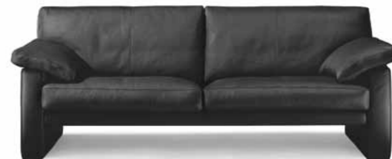
Sofa 2,5 Sitzer // Sitzhöhe: 43 cm // Bezug: Leder 43.136 schwarz