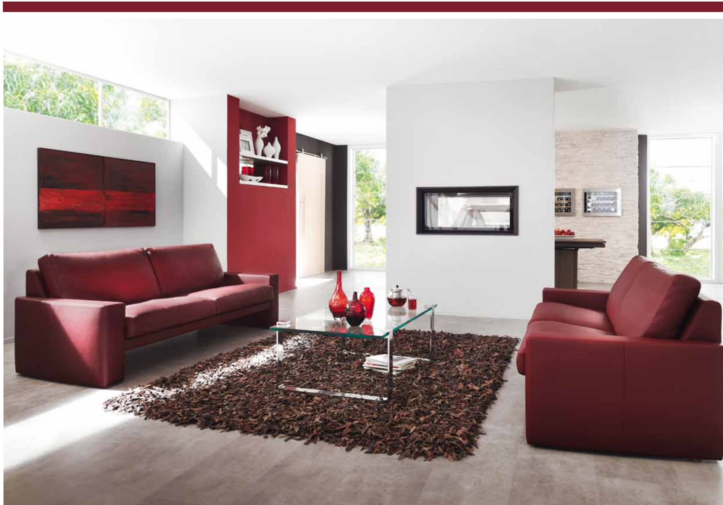
Sofa 2 Sitzer // Sofa 2,5 Sitzer // Sitzhöhe: 43 cm // Bezug: Leder 43.135 bordeaux