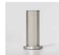
CL 60 / Ø 40 mm