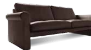
2,5 Sitzer Sitzhöhe: 43 cm Bezug: Leder 170.089 mocca