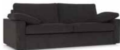
2 Sitzler Sitzhöhe: 43 cm Bezug: Stoff Metro 8909.6102