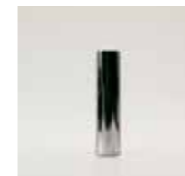
CL 10 / Ø 30 mm