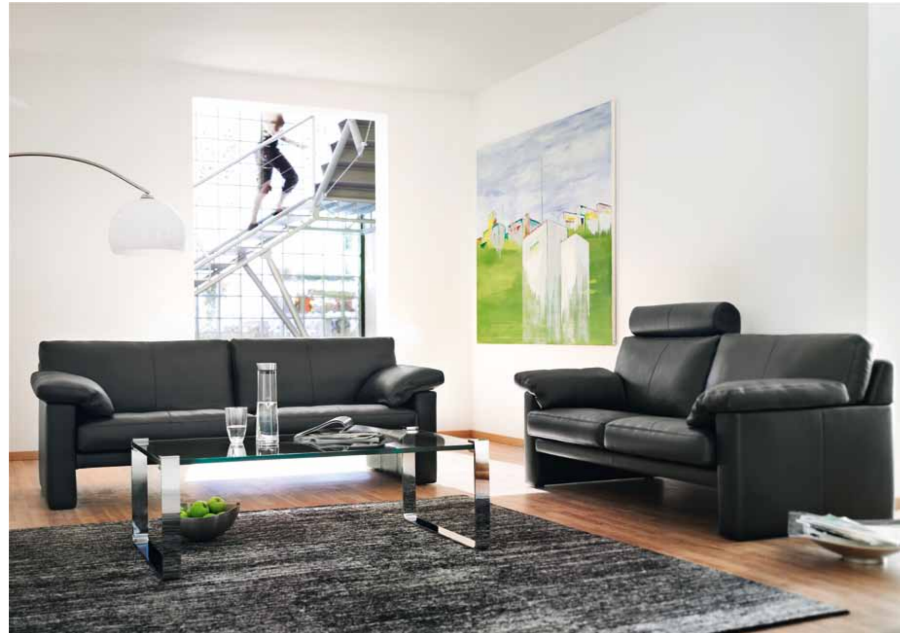
Sofa 2,5 Sitzer // Sitzhöhe: 43 cm // Bezug: Leder 43.136 schwarz