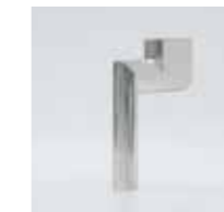
CL 7 / 37 x 25 mm