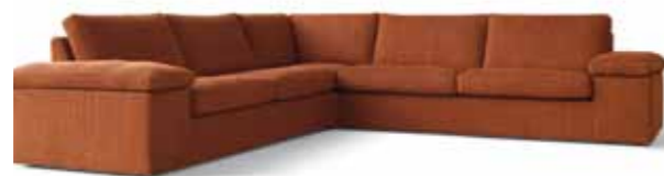
Eckkombination Sitzhöhe: 43 cm Bezug: Stoff Largo 1090.600