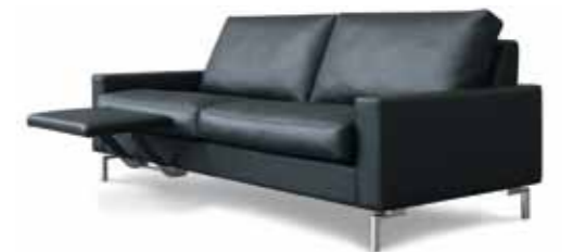
2,5 Sitzer // Sitzhöhe: 43 cm // Bezug: Leder 170.136 schwarz

Mit einer Armlehne, die sich nach oben verbreitert, und den konisch zulaufenden Füßen ist die CL 500 eine Neuheit, die jedem modernen Wohnambiente einen Hauch Romantik verleiht.