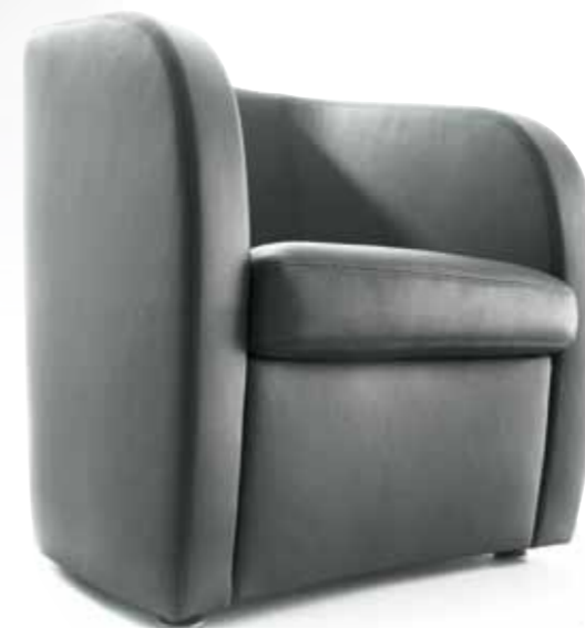
Sessel // Sitzhöhe: 42 cm Bezug: Leder 43.059 anthrazit

Die runde Gestaltung des CL 130 nimmt die Tradition unserer Erfolgsmodelle CL 120 und CL 190 auf und setzt sie in eigenständiger Form fort. Die voluminöse Gestaltung strahlt Ruhe und Sicherheit aus.