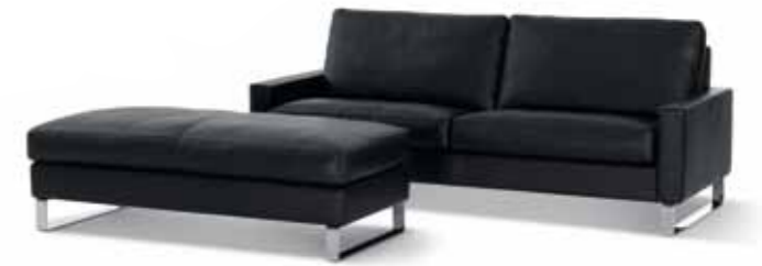
2,5 Sitzer // Sitzhöhe: 43 cm // Bezug: Leder 43.136 schwarz