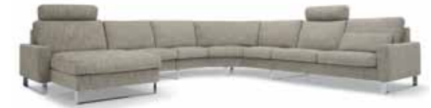
Eckkombination // Sitzhöhe: 43 cm // Bezug: Stoff Bonny 1020.041