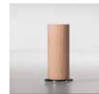
CL 12 / Ø 50 mm

Passend zu den bodenfreien Modellen mit Armlehnen steht eine breite Palette von Fußvarianten in unterschiedlichen Formen, Materialien und Oberflächen zur Verfügung.