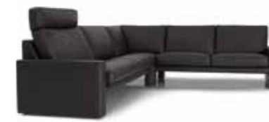
Eckkombination Sitzhöhe: 43 cm Bezug: Leder 43.136 schwarz