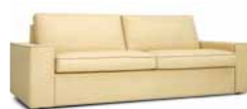
2 Sitzler Sitzhöhe: 43 cm Bezug: Leder 250.300 natur