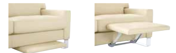
Auch Ihre Füße erhalten immer den Komfort, den sie benötigen.