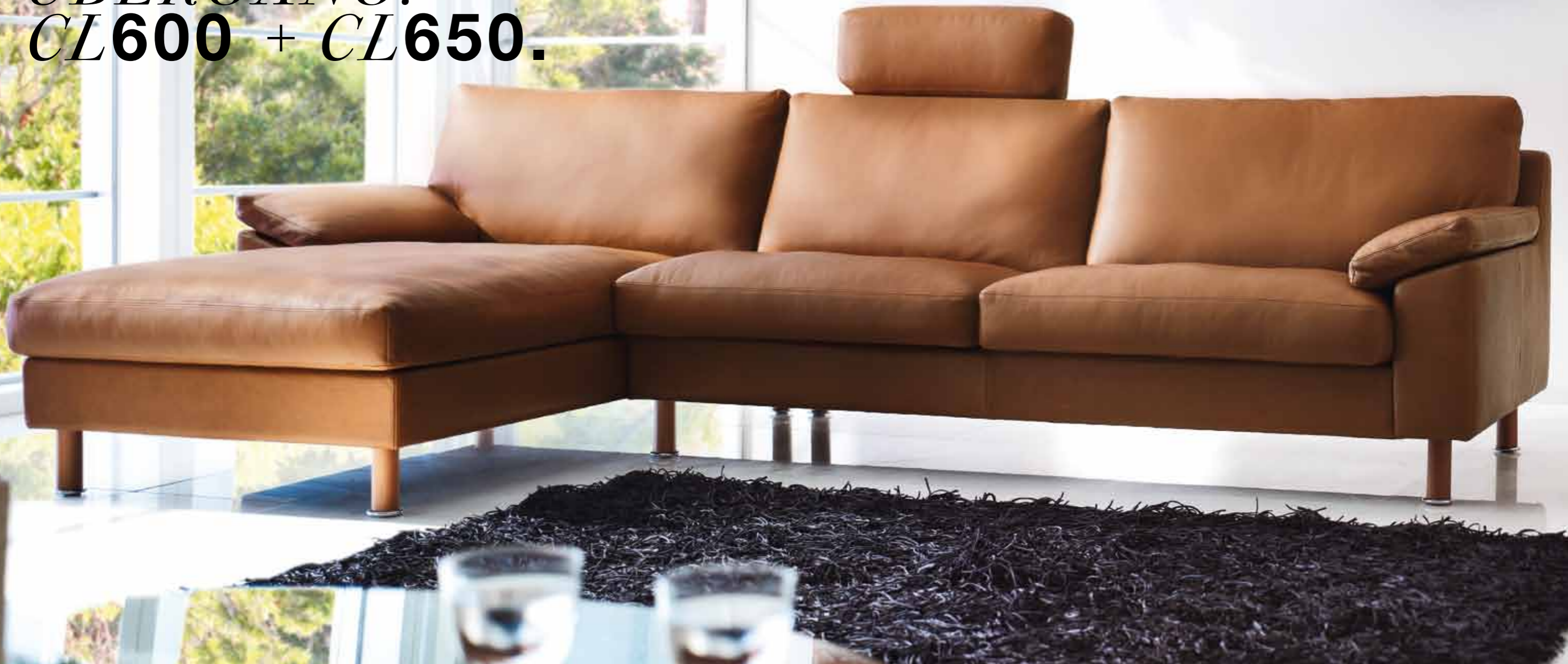
Sofa 2,5 Sitzer mit Longchair // Sitzhöhe: 43 cm // Bezug: Leder 250.850 tabac

CL 600 und CL 650 modulieren die Design-Philosophie der Classics-Serie in eine neue Tonart. Die Linearität des Gesamtkonzepts wird aufgebrochen durch eine aufwendig gearbeitete Aussparung des Rücken kissens. Dadurch entsteht der Eindruck, dass Rücken kissen und Armleh- nissen ineinander übergehen. Die Seitenwangen können wahlweise von eleganten Füßen aufgefangen oder bis zum Boden geführt werden.