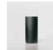
CL 40 / Ø 60 mm