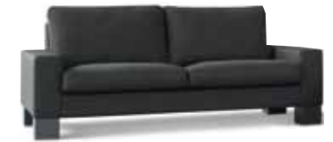
2,5 Sitzer // Sitzhöhe: 43 cm // Bezug: Leder 43.136 schwarz