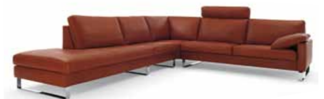
Eckkombination // Sitzhöhe: 43 cm // Bezug: Leder 350.870 terra