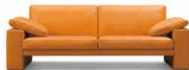
2,5 Sitzer Sitzhöhe: 43 cm Bezug: Leder 450.840 mandarin