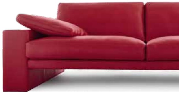
2,5 Sitzer // Sitzhöhe: 43 cm // Bezug: Leder 450.150 rot