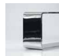
Kufe 8 / 80 mm