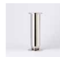
CL 82 / Ø 35 mm