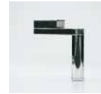
CL 9 / Ø 30 mm