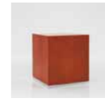
CL 23 / 92 x 92 mm