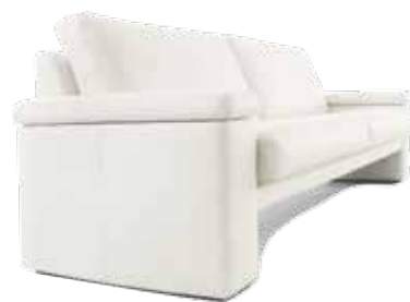
2,5 Sitzer // Sitzhöhe: 43 cm // Bezug: Leder 190.990 weiß

Breite, bis zum Boden reichende Wangen sowie das flach lagernde Gesamt-Werk drücken Sicherheit und einen dauerhaften Wert aus. Die strenge Linienführung dieses Konzepts wird durch die Diagonalen der Armlehnen aufgelockert. Verschieden breite Armlehnen setzen ebenso Akzente wie die Ausführung in einem kräftigen Rotton.