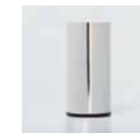
CL 50 / Ø 60 mm