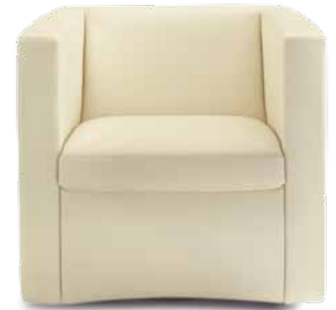
Sessel // Sitzhöhe: 43 cm Bezug: Leder 43.310 beige

Auf den ersten Blick streng kubisch, offenbart der zweite Blick auf den CL 140 die leicht konkave Gestaltung des Fußbereichs. Etwas Besonderes kommt hinzu: Der Drehteller verfügt über eine eingebaute Feder, mit der das Objekt immer wieder auf die Ausgangsposition zurückdreht, sobald Sie es verlassen haben.