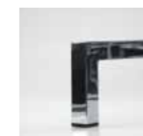
Kufe 3 / 30 x 30 mm