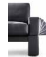
Ausstattungsmerkmal: verstellbare Armlehne