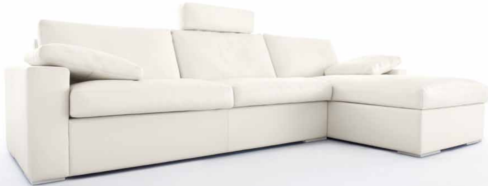
Eckkombination // Sitzhöhe: 43 cm // Bezug: Leder 43.990 weiß