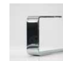
Kufe 5 / 50 mm