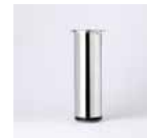
CL 30 / Ø 40 mm