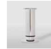
CL 80 / Ø 30 mm