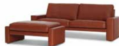
2,5 Sitzer Sitzhöhe: 43 cm Bezug: Leder 350.870 terra