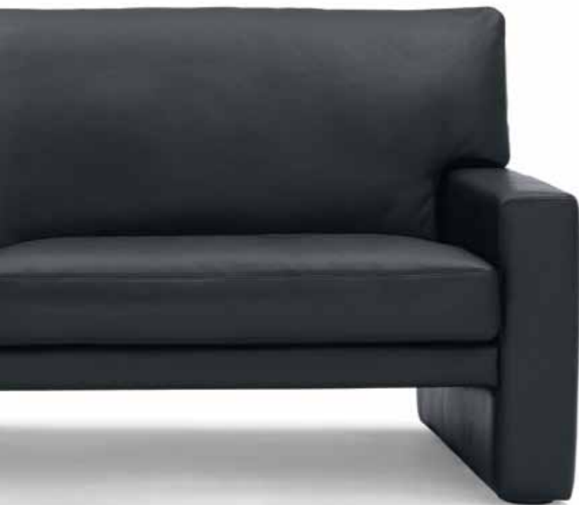
Sofa 2,5 Sitzer // Sitzhöhe: 42 cm // Bezug: Leder 43.136 schwarz