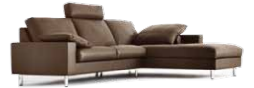
Eckkombination // Sitzhöhe: 43 cm // Bezug: Leder 180.860 lava

Eckkombination // Sitzhöhe: 43 cm // Bezug: Leder 45.089 mocca